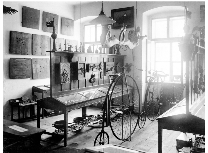
Instalace sbírek ve 30. letech 20. století ve staré školní budově na náměstí. Vlevo na stěně sbírka střeleckých terčů, které do muzea věnoval v roce 1894 měšťanský pivovar ze střelnice strakonického spolku ostrostřelců.

zaslaných“, se nachází i ve výčtu „Předmětů darovaných museu a pro museum koupených“. Které předměty byly do Prahy poslány, nám přibližuje výstava 120 let muzea instalovaná ve výstavních prostorách hradu. Jednalo se zejména o národopisný materiál (pleny, čepce, sukne, šněrovačky, džbány, mísy, dýmky, tabatěrky, šavle, kolovrátky, klíče, mince, kroupky, obrázky svatých), ale i památky po významných strakonických rodících a osobnostech (razítko a německé vysvědčení pátera J. Šmidingera, dílo strakonického rodáka F. L. Čelakovského Pomněnky vatavské, jeho dopisy a model rodného domku). Za účelem prezentace zdejší výroby byla do Prahy poslána různá barviva, druhy vln, hedvábí, čapek, krojů, přehled výroby fezů a stávek. Mnohé z předmětů byly po vrácení z Prahy zapsány do sbírky muzea. Některé se v muzeu dochovaly dodnes a jsou vystaveny ve stálé expozici. Muzeum se zajímalo také o památky řemeslné výroby a památky na místní spolky. Ve 30. a 40. letech 20. století muzeum navázalo na sbírkotvornou činnost z 19. století. Vedle výše