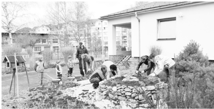
Do prací na přírodní zahradě u mateřské školy se zapojili i ti nejmenší. Jejich rodiče se postarali o materiál a ochotně přiložili ruce k dílu.