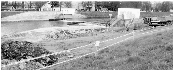
Jez Na Křemelce se díky propusti stane bezpečnějším.