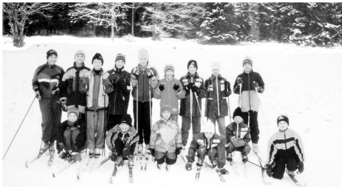
Družstvo běžců (rok 2000).