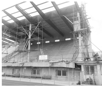
Oprava tribuny.

Rekonstrukční práce na tribuně ve sportovním areálu Na Sídlišti jsou u konce. Bezmála šedesát let stará stavba již v květnu bude opět sloužit veřejnosti.