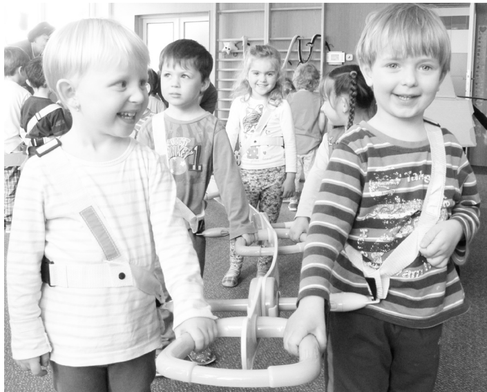
Na bezpečnostní chodítko si nejmladší děti ze školky rychle přivyklý.

vhodná pro malé chodce teprve se seznamující s pravidly silničního provozu a dosud nenavyklé organizované chůzi. Skládá se z tzv. „flexibilní páteře“, na níž se nacházejí držátka pro děti a bezpečnostní spony, jimiž jsou malí chodci připojeni ke konstrukci. Reflexní postroj navíc výrazně zvyšuje viditelnost dětí.