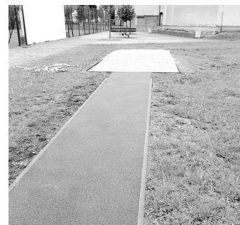
Skok daleký – dokončení.

Takováto úprava rozběhové dráhy a doskočité je podle projektové dokumentace v souladu s případnou, v budoucnosti uvažovanou, celkovou modernizací areálu, kdy by měl škváru a travu nahradit umělý povrch.