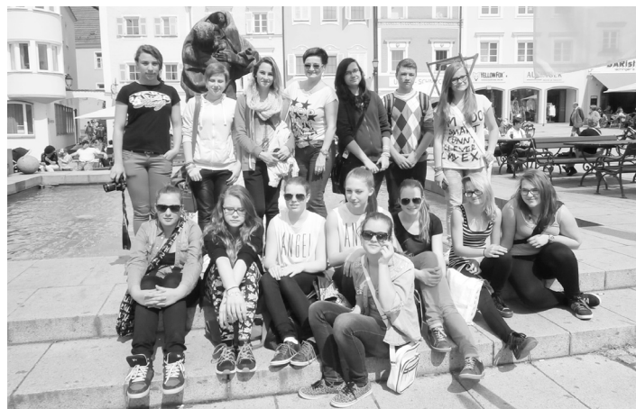
Žáci osmých a devátých ročníků ZŠ Poděbradova navštívili partnerskou školu v rakouském Taufkirchenu.

Zároveň se naši žáci účastnili i vyučování v partnerské škole, která patří k nejmodernějším v celém Rakousku. Někteří se ocitli v hodině chemie, jiní fyziky, pracovní-