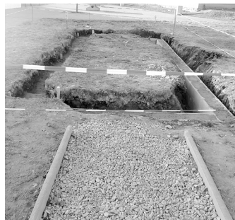
Skok daleký – stavba.

Travnatá plocha hřiště u Základní školy Dukelské se po loňských úpravách zazelenala. V říjnu byl na nejvíce zatěžovanou část hřiště o velikosti 945 m 2 položen travní koberec a zbytek zelené plochy byl oset travou. Úpravy se dotkly také škvárové běžecké dráhy, která má nyní stan-