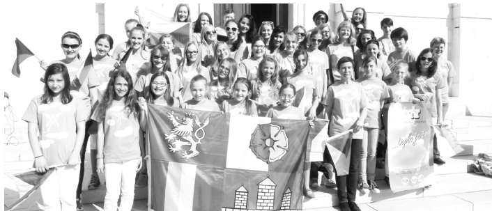
Dětský pěvecký sbor Fere Angeli se zúčastnil festivalu v chorvatské Poreči.

trochu vlastenectví a rozdali spoustu turistických průvodců po Strakonících. Při cestě domů jsme se zastavili v Postojenských jeskyních. Prohlídka končila v obrovské krápníkové jeskyni zvané „Koncertní sál“. Samozřejmě jsme si jeho akustiku vyzkoušeli a je opravdu