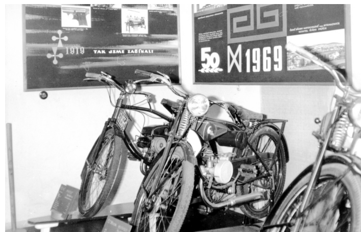
Expozice Českých závodů motocyklových před rokem 1970.

Ve druhé polovině 20. století muzeum spravovalo kromě muzejních sbírek také některé historické objekty – např. instalovanou expozici v rodném domku F. L. Čelakovského, hrad Helfenburk, areál husitského bojiště u Sudo-