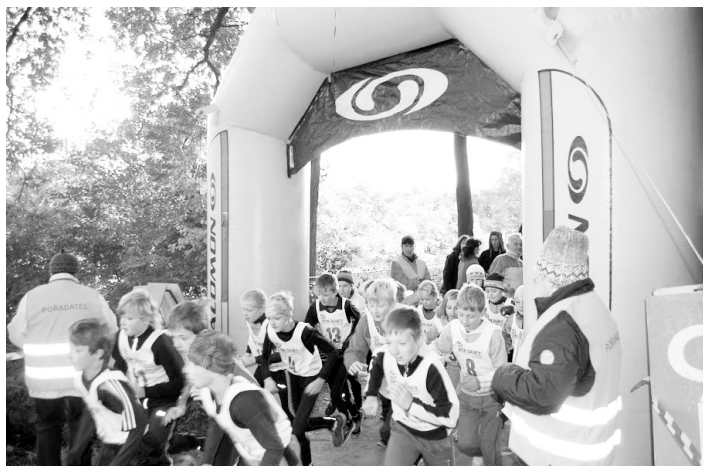
V roce 2001 byl obnoven Běh okolo Kuřidla.

10 z ostatních měst ČR). Jiří Voraček se stal jedním z hlavních trenérů kraje. Do zařízení v pronájmu od TJ ČZ byly nainvestovány nemalé prostředky (chata Střecha – výměna oken ve 2. patře, nová kotelná, bojler pro ohřev vody, vrt pro zásobování objektu vodou, rezervoár na vodu pro zasnežování, čerpadla, potrubí pro zásobování sněžného děla a další, dolní stanice – výměna balkono-