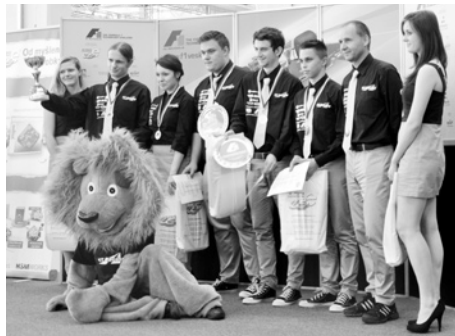
Úspěšný tým si otevřel cestu na světový šampionát. Nyní hledá sponzory.

Skvělého úspěchu dosáhli studenti Vyšší odborné, Střední průmyslové a Střední školy řemesel a služeb ve Strakonících. V mezinárodní vzdělávací soutěži Formule 1 ve školách se stali českými šampiony a mají šanci zúčastnit se mistrovství světa v Abú Dhabí.