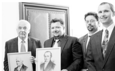
Pracovníci odboru životního prostředí na akademické půdě s prorektorem Wrocławské univerzity Adamem Jezierskim.

Do polské Wrocław se vypravili v červnu zástupci města Strakonice, aby zde převzali zvláštní ocenění udělené v rámci Ceny Rady Evropy pro krajinu za desetiletý projekt Ekologická výchova města Strakonice rok za rokem aneb Putování zemí zamyšlenou.