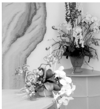
Nová květinová výzdoba obřadní síně Městského úřadu Strakonice.

Stále častěji se obrací snoubenci na Městský úřad ve Strakonici se žádostí o uzavření manželství na různých místech v rámci správního obvodu našeho matričního úřadu. Snoubenci si oblíbili prostory v blízkosti hotelů a restauračních zařízení, ale i soukromí zahrad a domů. Matriční úřad vychází z žadatelům vstřícně, ale vždy musí posoudit vhodnost vybraného místa pro konání sňatečného obřadu zejména s ohledem na zachování slavnostního charakteru a důstojnosti tohoto aktu.