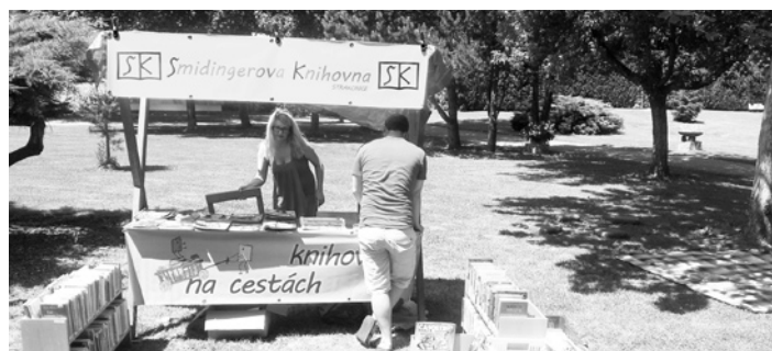
V areálu venkovního plaveckého stadionu můžete využít služeb knihovny.