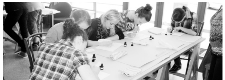
Archivního minikurzu se zúčastnili žáci základních a středních škol.

kách, jež platily na našem území, dovědlo se základní informace o erbech a pečeti týkajících se jižních Čech, rozšířilo si své znalosti v oblasti latiny, a také se naučilo několik základních praktic-