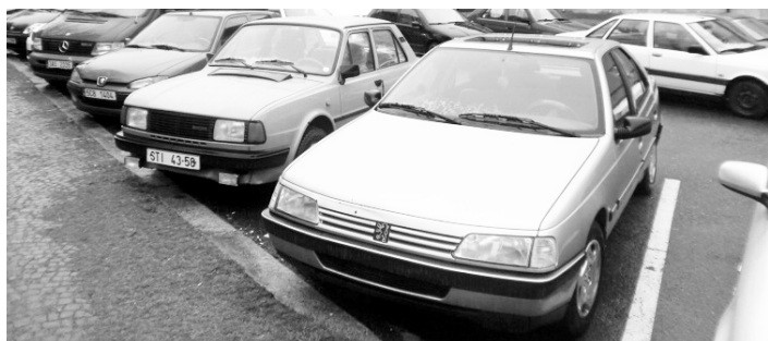
Městská policie hledá majitele vraků, v případě informací volejte prosím linku 156.