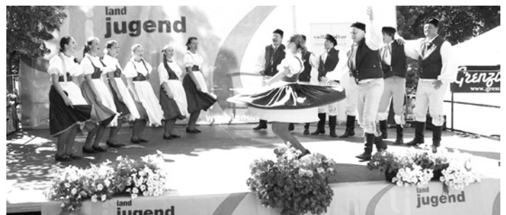
Strakonický Prácheňák vyhrává, tančí a zpívá prácheňské lidovky a tance za oceánem na folklorním festivalu v mexickém Tulancingu.

bude odehrávat v nadmořské výšce nad 2000 m. n. m. Proto se všichni scházeli na zkouškách a trénovali, aby je pak řídký vzduch nepřekvapil tolik, jak by mohl.