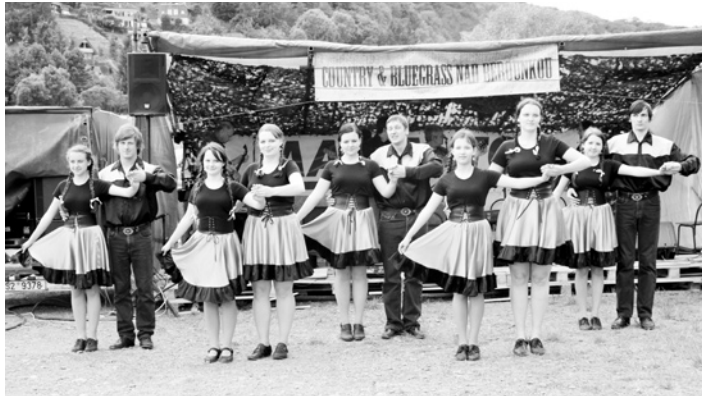
Country taneční skupina Osm a půl opice ukázala své taneční umění po Čechách.

ních čísel, které během tří koncertů zhlédli děti od tří let až po pana starostu a dospělé publikum při večerním hlavním programu. V Račicích se formou dobrovolného vstupného vybrala pro klienty částka 10 000 korun, která pomůže na zakoupení slunečnicku na