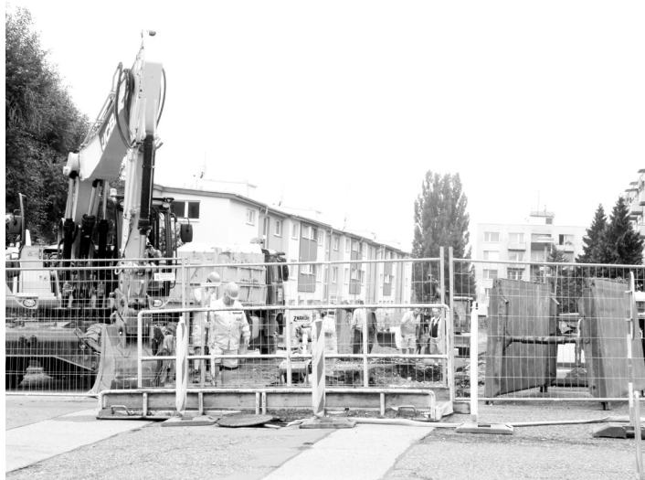
Stavební ruch v Mlýnské ulici.