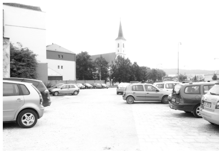
Parkoviště v Podskalské ulici získá nový povrch.