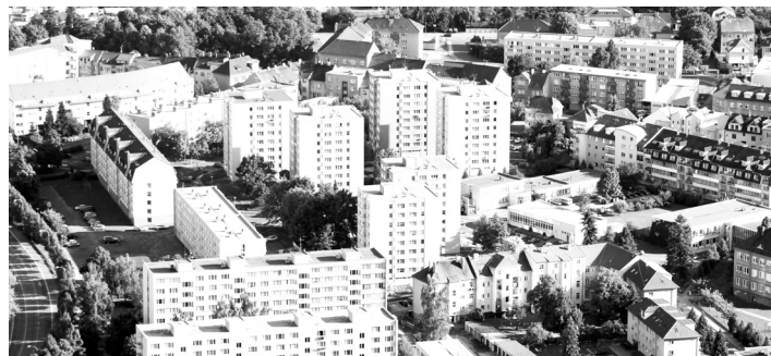
Sídliště Stavbařů prochází postupnou revitalizací.

Výsadbou smíšených odrůd dřevin v katastru obce Hajská vznikne druhově rozmanitá, jednostranná alej tvořící doprovod stávající oblužné komunikace mezi poli a loukami, která je využívána obyvateli města (cyklotrasa směr Přeštovice, návaznost na cyklo a in-line stezku Hajská–Sedlívovice). Město Strakonice získalo dotaci z Operačního programu Životní prostředí ve výši 90 % výdajů.