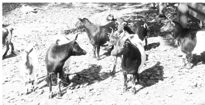
Stádo koz v hradním safari.