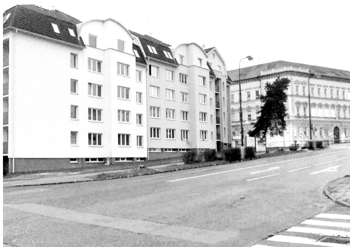
Vzrostlá borovice ohrožovala bezpečnost, proto byla v polovině října pokácena.

Bohužel výsledky měření ukázaly, že hodnoty odolnosti vůči vývratu a také vůči zlomu jsou pod hodnotami udávanými jako norma pro stabilní stromy. Interpretace výsledku je taková, že by u stromu