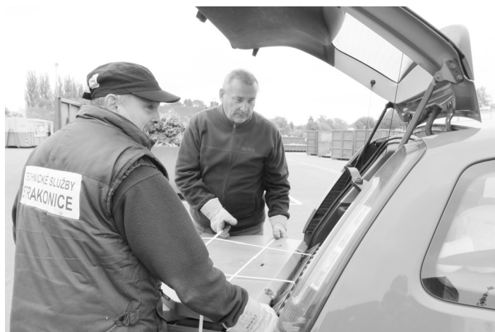
Složený kompostér putoval do kufru spokojeného majitele. S jeho nakládáním pomáhali pracovníci sběrného dvora U Blatenského mostu.