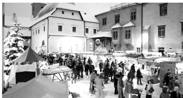
Nádvoří strakonického hradu se promění v tržišť.