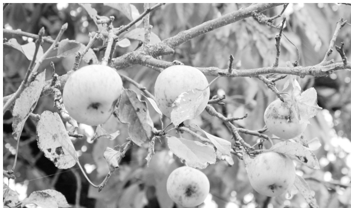
Původní odrůdy ovocných stromů budou navráceny zpět do přírody.