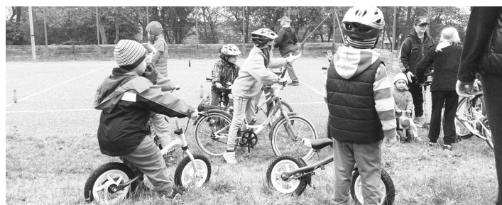
Malí cyklisté si vyzkoušeli svoji zručnost.

Velmi. Návštěva (okolo 400 lidí) překvapila i samotné organizátory. Ochutnávka jídel se setkala s kladnou odezvou, stejně jako zeleninové divadlo nebo dílničky