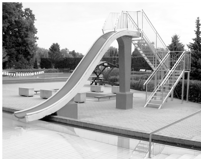
Pro malé návštěvníky letního areálu byla zmodernizovaná skluzavka u dětského bazénku.

ženy (50m bazén, bazén s toboganem a dětský se skluzavkami), hřiště na minigolf, beachvolejbal, nohejbal, basketbal, fotbal, dětské pískoviště s houpačkami a několik provozoven s občerstvením.