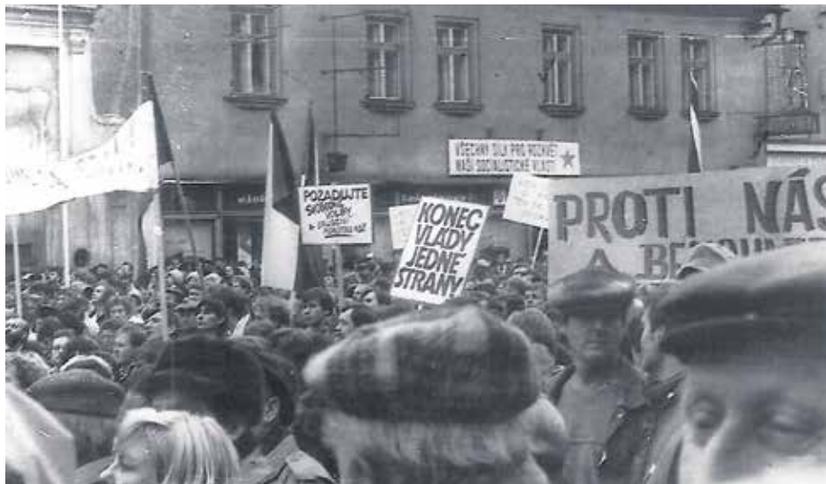
Události roku 1989.