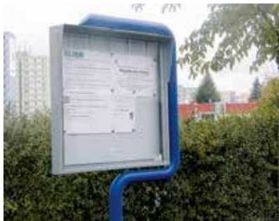
Opravená informační tabule.

Od října má infocentrum k dispozici novou informační desku před OD Prior. Na vývěsce bude vždy zveřejněn aktuální přehled akcí a aktivit. Další novinky mohou seniory najít na webových stránkách města Strakonice.