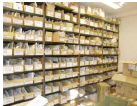
Sklad SPZ vozidel umístěných v depozitu.

oznámení adresy místa a účel využití vyřazeného vozidla jen s tím rozdílem, že takové vozidlo nezanikne, ale majitel se vystavuje nebezpečí nemalých finančních sankcí, pokud toto oznámení nepodá.