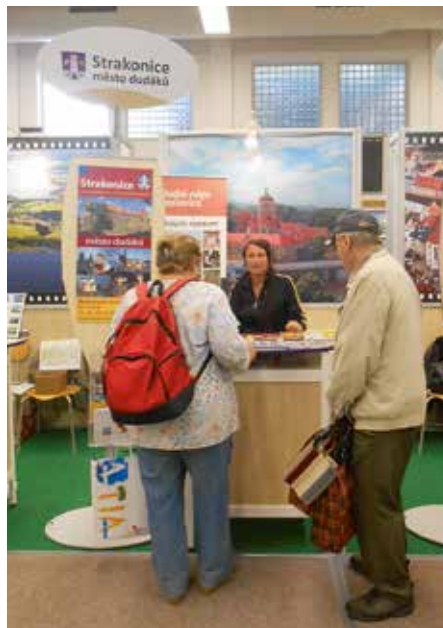
Veletrh ITEP v letošním roce navštívilo 11 500 lidí.

Naše městské informační centrum zvalo k poznání míst, která se objevila např. ve filmech Hvězda padá vzhůru (Strakonice); Tři chlapi na cestách (Strakonice); Slunce, seno... (Hořovice u Volyně) a filmových pohádkách Šíleně smutná princezna (Blatná); Kouzla králů; Vodník a Karolínka nebo Tři bratři (mlýn Hoslovice). Další pozvánka, již pro příští rok, samozřejmě patřila mezinárodnímu dudáckému festivalu, který se bude konat 25.–28. srpna 2016.