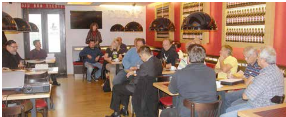
Vedení města se sešlo se zástupci obcí strakonického regionu.