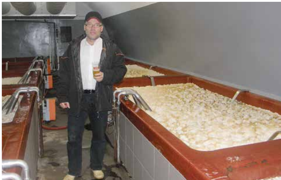
Spilka strakonického pivovaru.

Možná jste to zaslechli, jedná se o tzv. technologii - high gravity brewing, která spočívá v ředění piva. Některé velké pivovary často vaří silné várky, které se pak ředí na nižší stupňovitost.