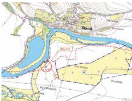
Situční plánek umístění vrtu.

Prvním krokem, který probíhá v současnosti a svým dílem podpoří zajištění dostatečného množství surové vody pro úpravnu, je vyhotovení hydrogeologického průzkumného vrtu Ha-V5 na západním okraji jímacího území v blízkosti vodního toku Otava. Vrtáno je jádrově průměrem 156 mm do konečné hloubky 40 m. Následně bude hlouben jímací vrt počátečním profilem 630 mm do hloubky cca 6–7 m a do konečné hloubky 35 m bude pak vrtáno bezjádřově průměrem 495 mm. Nový vrt bude vystrojen