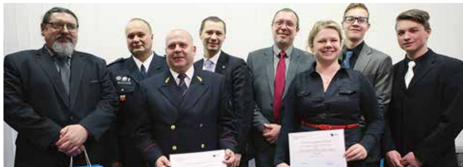
Mezi dospělými se mladí strakoničtí realizátoři preventivních aktivit neztratili.