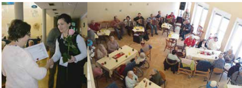
Srdečná atmosféra a dobrá nálada k domovu patří.