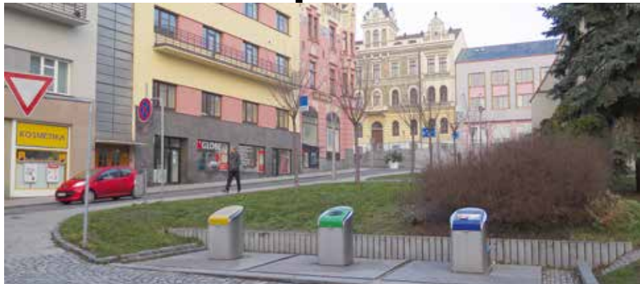
Podzemní kontejnery v blízkosti Velkého náměstí.