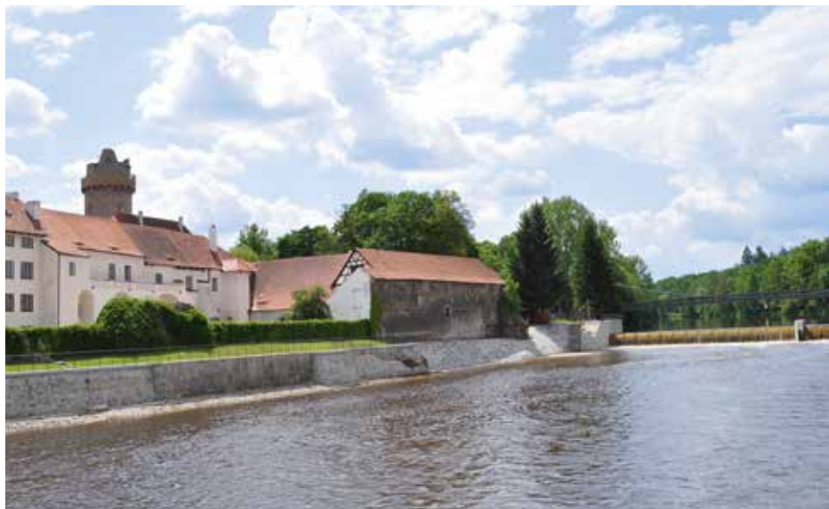
Přirozené spojení strakonického hradu s řekou Otavou.