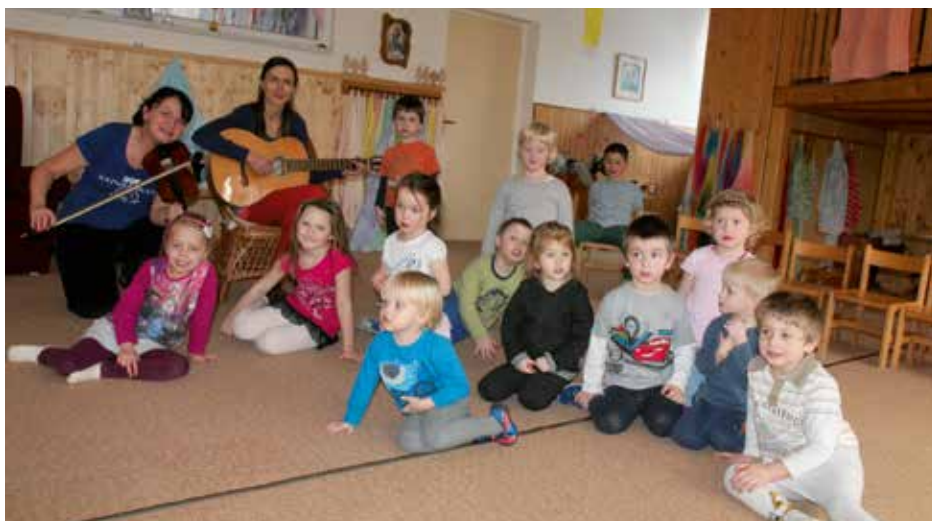
Kolektiv dětí waldorfské třídy.

Jde o výukové programy v rámci environmentální výchovy. Společně poznáváme přírodní krásy Strakonicka. Pořádáme výlety se zaměřením na poznání přírody a místa, kde děti žijí.