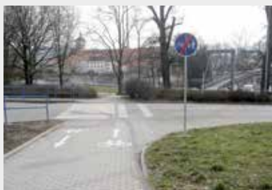
Označení na cyklostezce před pivovarem.