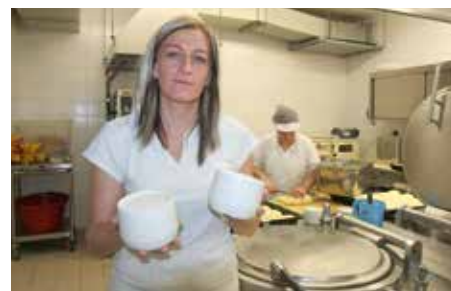
Vedoucí školní jídelny

Upozornění: zápisy do všech strakonických mateřských škol se uskuteční 11.–12. dubna 2016 v čase od 9.00–16.00 hodin.