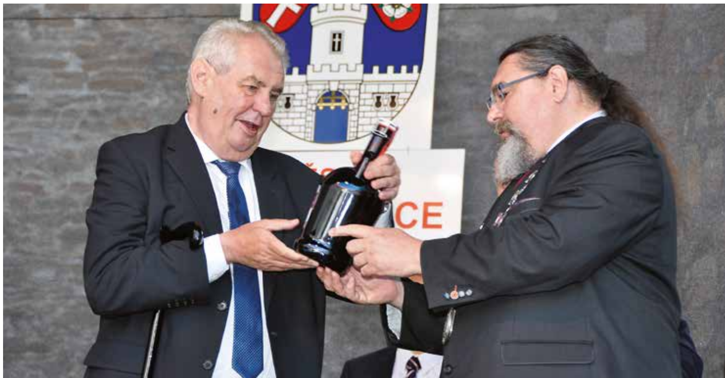
Prezident Miloš Zeman převzal od starosty města Břetislava Hrdličky láhev prezidentského pivního speciálu.