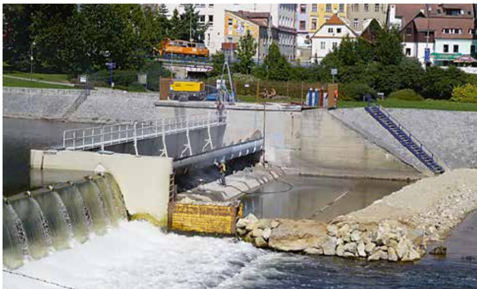
Snímek zachycuje práce na Pětikolském jezu.