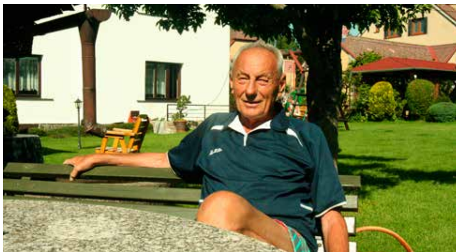
Chvilka relaxace na zahradě.