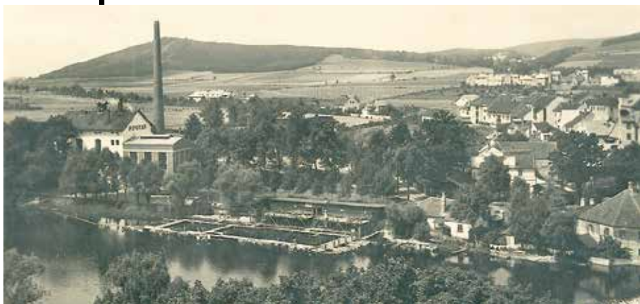
Dobový snímek plovárny ve Strakonících.

Jak už to tak chodí, vývoj a doba s sebou přináší novosti, kterým mnohdy dobře sloužící věci a zařízení musí ustoupit. S koncem války zanikla slavná éra plovárny. Avšak velký zájem o plavání si postupem času vynutil vznik