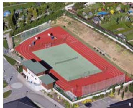
Sportovní areál Na Muškách.

Jitka Krýzová, vedoucí střediska sportovních hal a hřišť STARZ Strakonice