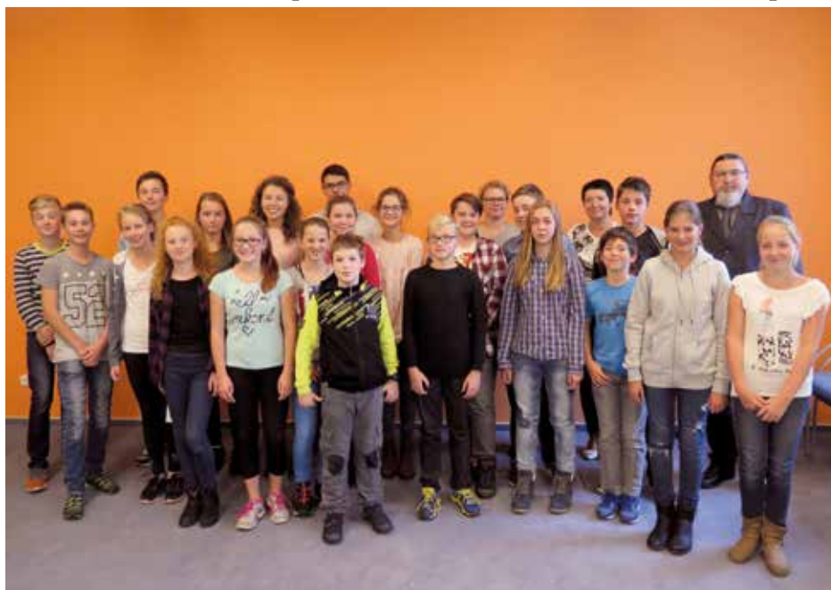
Noví dětsí zastupitelé