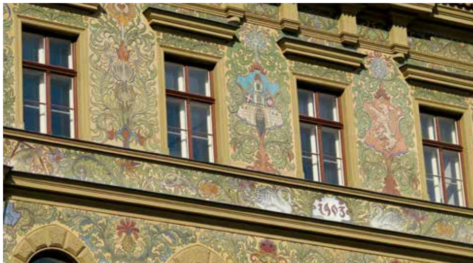
Letos byla zrekonstruována fasáda bývalé školy na Velkém náměstí