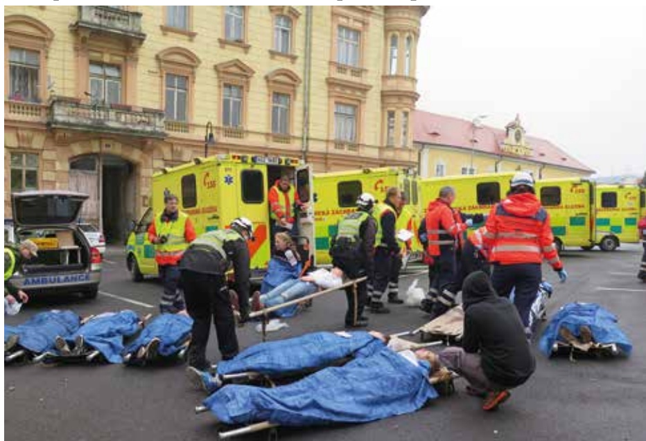
Figuranti se do role zraněných náležitě vžili