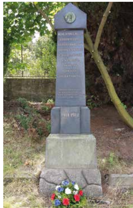
Válečný hrob na Podsrpu

Souhrnnou evidenci válečných hrobů, které jsou ve správním obvodu ORP Strakonice, vede podle zákona č. 122/2004 Sb., o válečných hrobech a pietních místech, Městský úřad Strakonice. Informace o válečných hrobech, o osobách v nich pohřbených nebo osobách připomenutých na pietních místech jsou zaznamenány v datové aplikaci Centrální evidence válečných hrobů a jsou veřejně přístupné na stránkách ministerstva obrany http://www.evidencevh.army.cz/Evidence/