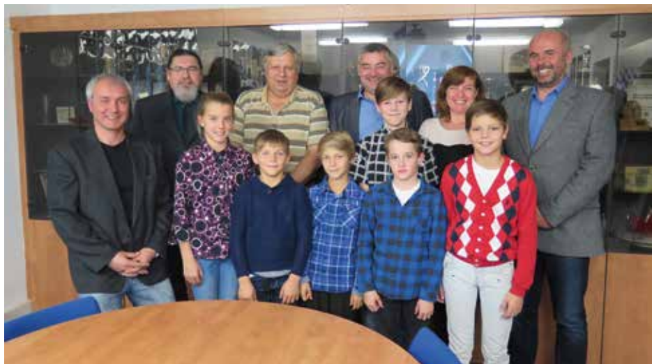
Mladí sportovci na návštěvě u starosty