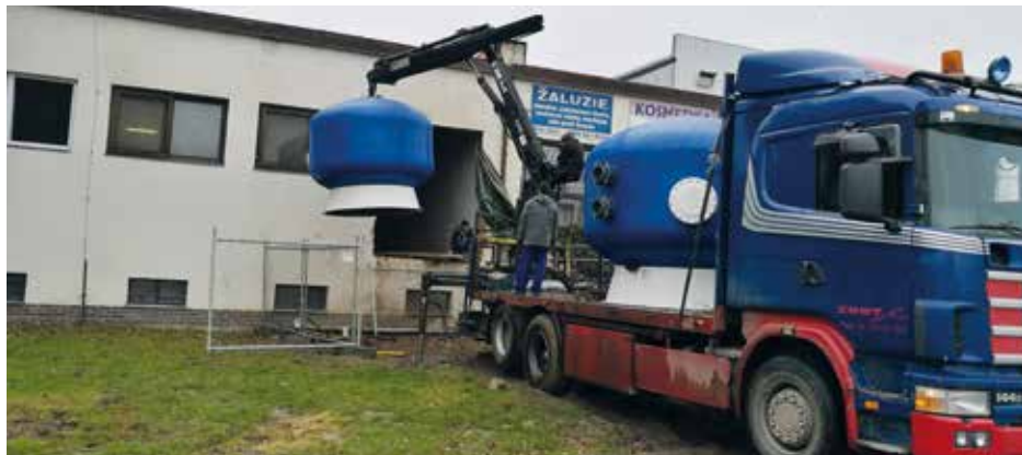
Instalace nových filtrů byla technicky náročná