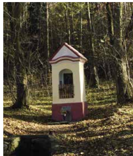
Na procházce Podsrpem nesmíte minout kapličku Panny Marie

Naši předkové věděli, proč na určitých místech vybudovat kapličky. Stojí vždy tam,