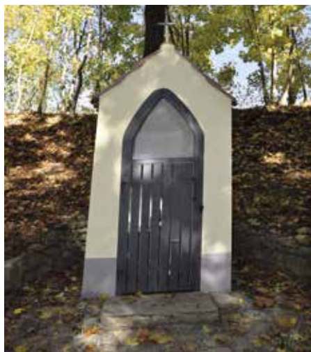
Důstojné zázemí pro svatého Petra

Další oprava sakrální památky je u konce. Řeč je o drobné kapličce ve skalnatém svahu strakonického Podskalí, kterou nechal někdy kolem roku 1880 postavit tehdejší