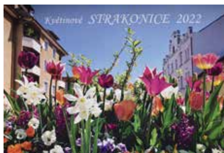
Markéta Bučoková, PR

Každým rokem vydává město Strakonice nástěnné kalendáře se zajímavými fotografiemi. Pro uplynulý i letošní rok byly zvoleny varianty květinové výzdoby našeho města. Pestrobarevná záplava fotografií vás může těšit po celý rok, a to za předpokladu, že navštívíte infocentrum v Zámku 1. Zde si zakoupíte letošní nástěnný kalendář za 210 Kč. Přejeme příjemný rok s rozkvetlými Strakonice.