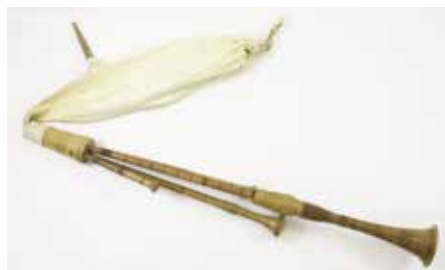
Zampogna gigante – největší dudy ve sbírce strakonického muzea získané z programu IROP

Muzeum středního Pootaví ve Strakonících se po dlouhé rekonstrukci znovu otevře v celém rozsahu na jaře 2022. Akce za více než 140 milionů korun je financována z fondů Evropské unie a z rozpočtu Jihočeského kraje, který muzeum zřizuje. Tentokrát vám představíme stálou expozici dud.