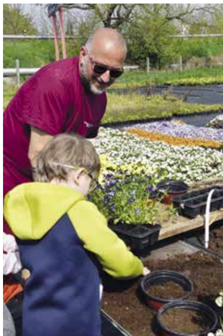
Děti sázely květiny

Zahradnictví pana Straky není jen o květinové výzdobě města a prodeji zeleniny, balkonovek a stromků. Cestu do zahradnictví si našla i Mateřská škola speciální sídlící v Plánkově ulici ve Strakonících. V rámci projektového dne přišly paní učitelky s dětmi do zahradnictví osazovat květináče maceš-