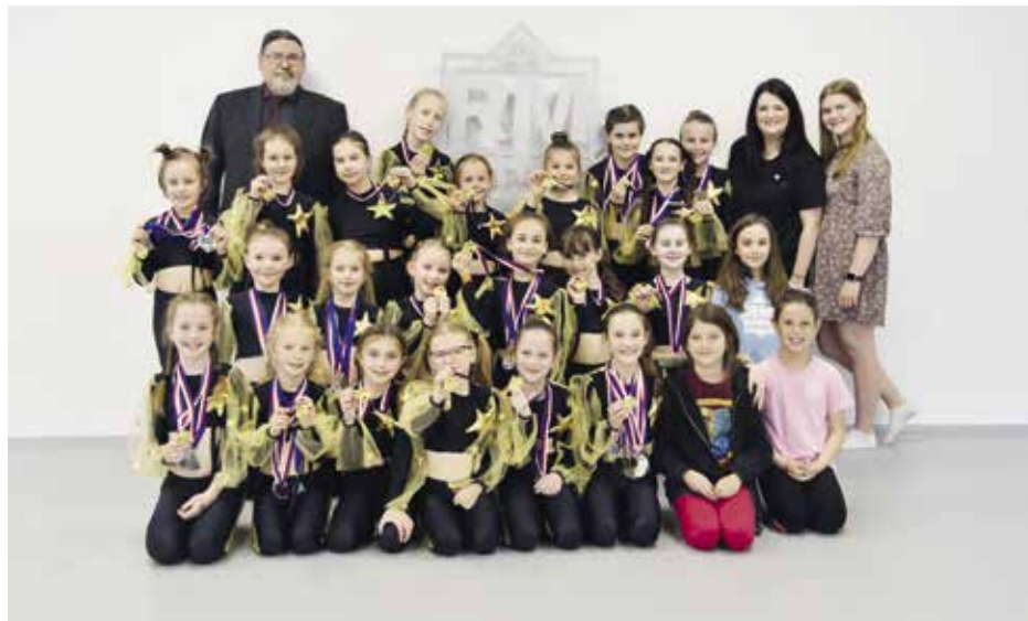
Zlaté dívky z RM Dance