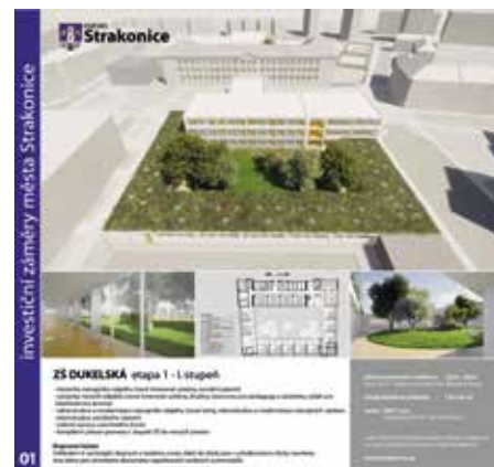
Informační panel modernizace ZŠ Dukelská

V současné době je navrženo sedm panelů mapujících sedm počínů – ZŠ Dukelská I. etapa, regenerace sídliště Šumavská, rekonstrukce sportoviště ZŠ Čelakovského – 1. stupeň, rekonstrukce sportoviště ZŠ Čelakovského – 2. stupeň, smuteční síň, dům kultury – rekonstrukce, úprava komunikace Katovická. Do budoucna se počítá s rozšířením počtu pane-