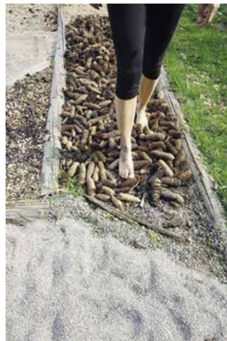
Bosý chodník po obnově

Prosíme o zodpovědné chování. Neničte bosý chodník, ať není práce zbytečná. Děkujeme. Tým nadšených dobrovolníků bosé chůze