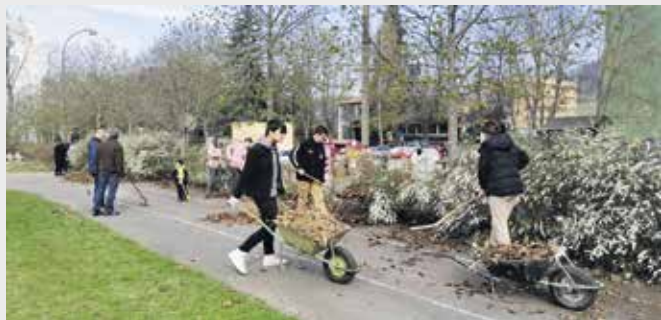
Žáci se zapojili do úklidu okolo své školy