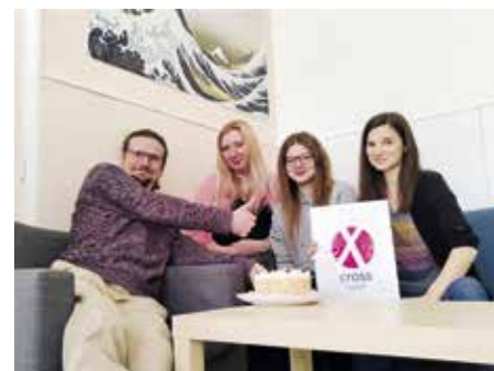
Tým Cross NZDM Prevent

Hodnotitelé kvality České asociace streetwork při auditu prověřovali me-