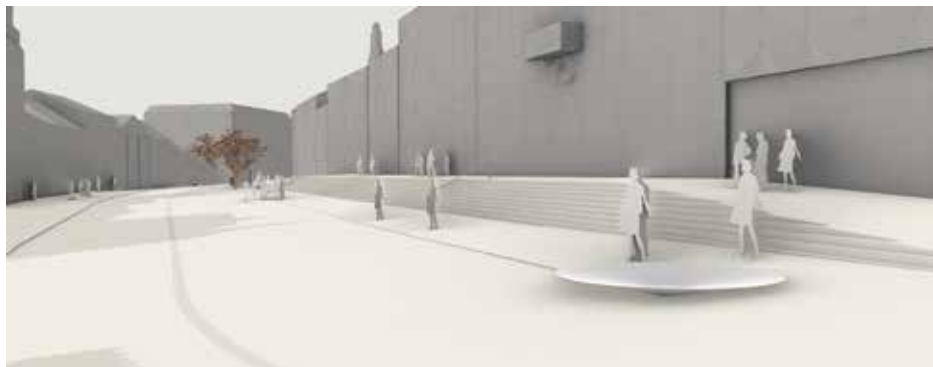
3D zobrazení nabízí pohled na vodní prvek na náměstí