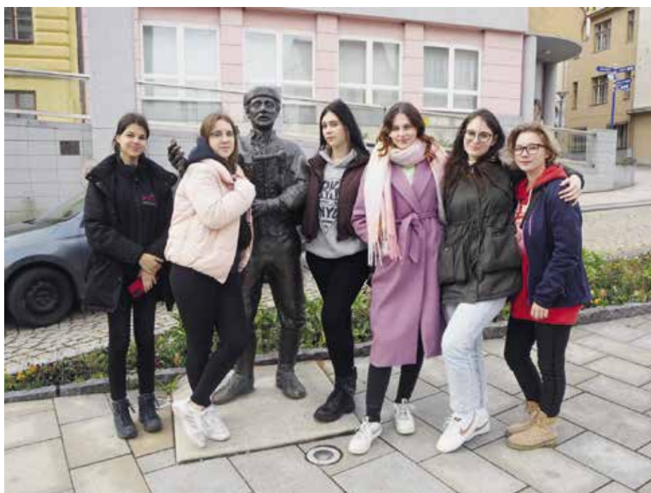
Okamžik z výměnného pobytu

Žáci oboru kuchař-číšník společně pracovali na elektronické kuchařské knize českých a slovenských receptů s akcentem na kuchyni daného regionu, žáci oboru kadeřník pak pracovali na obdobné elektronické knize zaměřené na společenské účesy a výčesy.