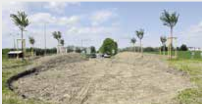
Úpravy na kruhové křižovatce finišují

Letem světem po strakonických kruháčích - projekt obnovy kruhových křižovatek kolegů z odboru životního prostředí ve Strakonici pokračuje. Konečné podoby se dočkal i příjezd od Horažďovic na Katovické.