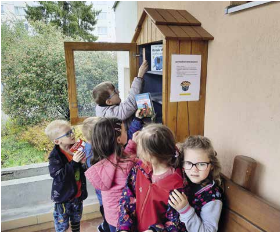
V prostorách školky je nově Knihobudka