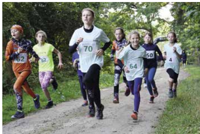
Běžci při závodu