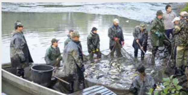
K podzimu patří neodmyslitelně výlovy rybníků

O slovo se hlásí, alespoň podle kalendáře, podzimní mlhy a s nimi i výlovy rybníků. Ty jsou předzvěstí nejen blížících se vánočních svátků, ale také přehlídkou rybářského umu, řádné chlupské síly a bohatství, které v sobě voda po celý rok ukrývala. Rybářský svaz nabízí možnost účasti na jednotlivých výloveh, při kterých nebývá nouze o dobré rybí speciality a něco na zapítí. Změny termínu jsou vyhrazeny.