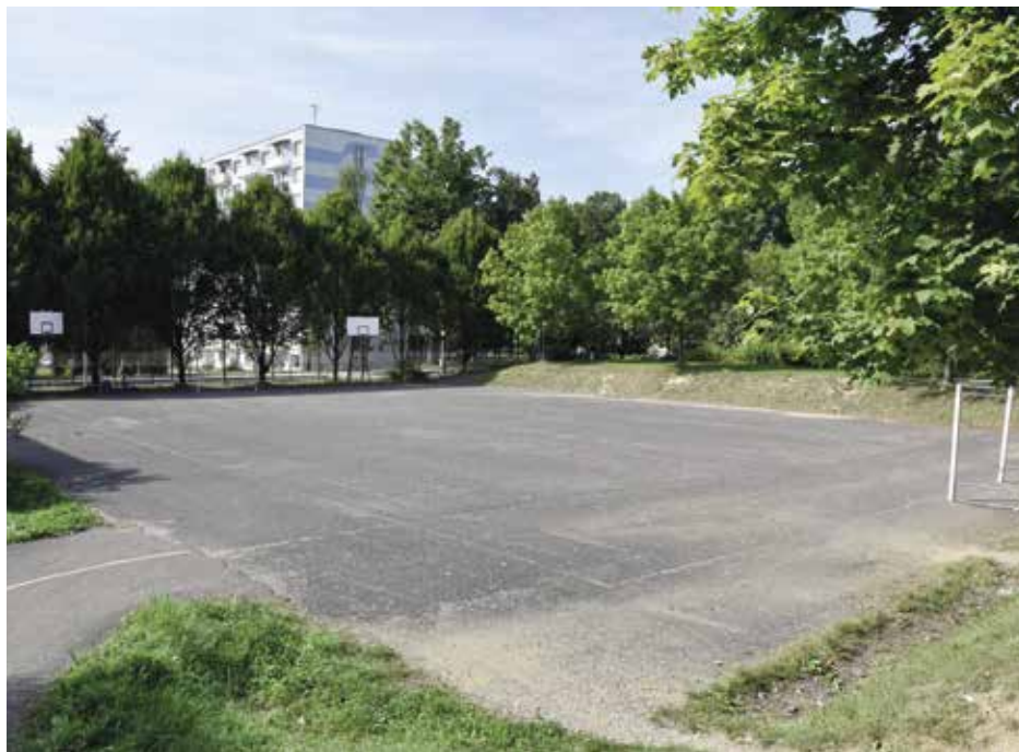
Plocha sportoviště již opravu nutně potřebuje