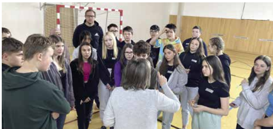
Cizojazyčná diskuze mezi žáky při výměnném pobytu