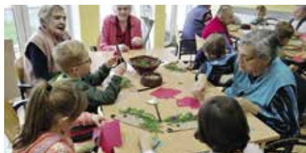
Chvilce vzájemné souhry dětí a seniorů

Naše mateřská škola Spojarů má dlouhodobou tradici s Domovem pro seniory v Rybnické ulici na Jezárkách ve Strakonících.