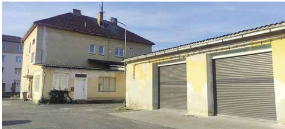
Stávající budova poslouží jako základ pro budoucí požární zbrojnici

Strakoničtí dobrovolní hasiči se dočkají nové požární zbrojnice. Ta současná stávající je z hlediska efektivnosti zásahů již nevyhovující. Nedostatek místa jak pro techniku, tak pro hasiče samotné, neekonomické vytápění. Zcela chybí zázemí pro úklid a údržbu techniky, vytápěný mycí box. Alarmující je stáří budovy, ve které jsou dobrovolní hasiči zasídleni. Pochází z roku 1955 a dlouhá léta sloužila jako sklady plzeňského pivovaru. Tedy zcela jinému účelu, než by dobrovolní hasiči, kteří se do ní v roce 1983 provizorně stěhovali, potřebovali. Pamětníci vzpomínají na to, jak si na vlastní náklady vybudovali garáže pro techniku. U hasičů totiž platí neměnné pravidlo. Nejprve technika, až poté lidé a zázemí pro ně.