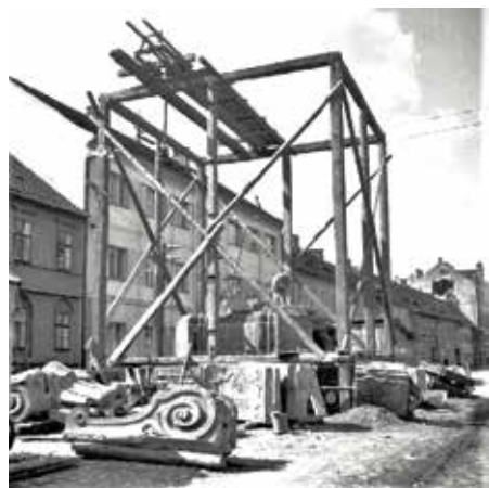
Dobová fotografie mariánského sloupu

Do prvního z deseti dílů seriálu o strakonických sochách jsme vybrali symbolicky mariánský sloup. Jeho historie je pohnutá a obestřena mnoha tajemstvími. Začtete se do následujících řádků, které vám budeme pravidelně přinášet ve spolupráci s periodikem Strakonický Deník.