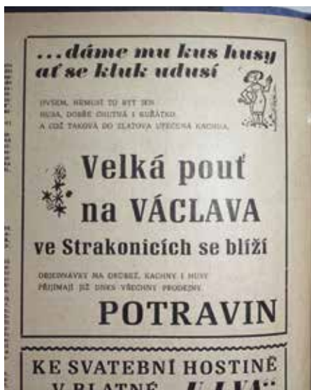
Naše noviny, 24. 9. 1970

Atrakce měly svůj hlavní stan stále na Ohradě, i když některé ročníky proběhly jinde, neboť docházelo k postupné regulaci řeky a konaly se zde stavební práce. Mezi novinky z řad kolotočů patřil takzvaný tobogán o délce 25 metrů. V roce 1923 dorazil dokonce i kolo-