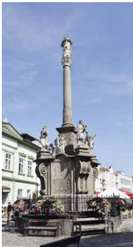
Současná podoba mariánského sousoší

Pátráme-li po památkách, nezbyvá nežli zabrousit do archivů a bádát v historických pramenech, které nějakým způsobem mapují přelomové události. Nejinak tomu bylo i v případě mariánského sousoší. Bohužel jednotlivé prameny se co do doby vzniku sloupu