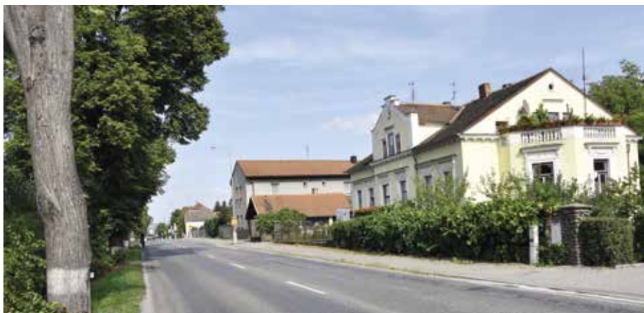
Komunikace Volyňská už volá po celkové rekonstrukci