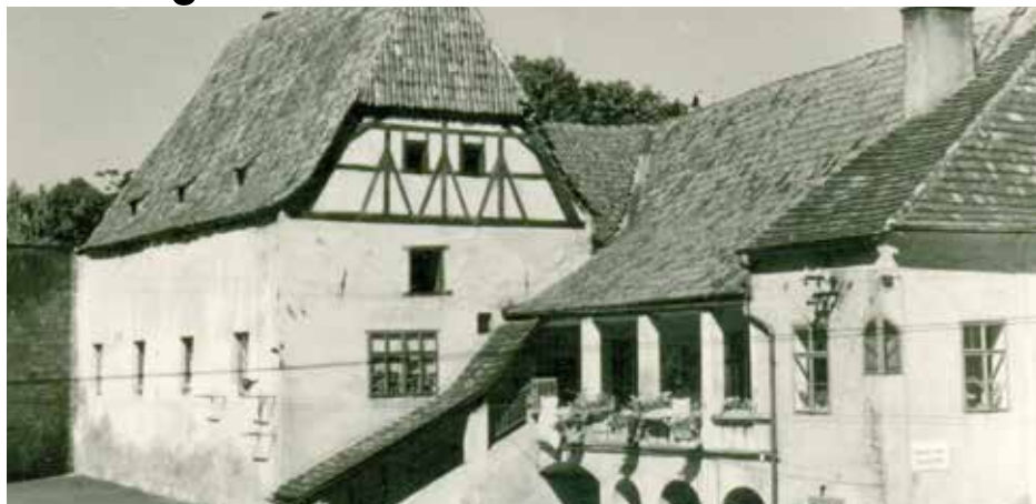
Do hradu byla knihovna přestěhována v roce 1949, předtím sídlila v tehdejší Besedě, sokolovně, ve škole nebo hotelu Nový svět