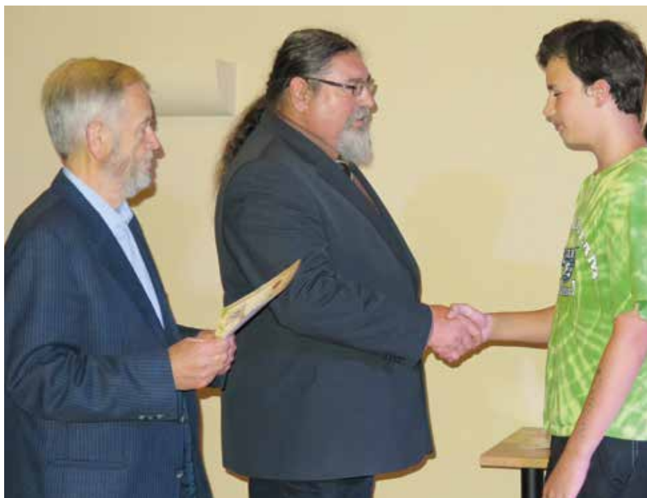
Snímek ze slavnostního předání prospěchových stipendií