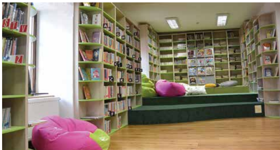
Oddělení pro děti