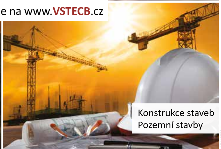
Konstrukce staveb Pozemní stavby