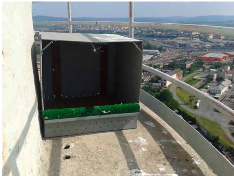
Budka pro sokola stěhovavého