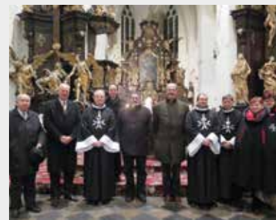
Významní hosté děkovné bohoslužby

Téměř na samém sklonku minulého roku jsme završili čas, ve kterém si celé město připomínalo významné výročí – udělení městských privilegií Bavorem IV. městu Strakonice. Událo se tak 8. prosince, kdy na den přesně před šesti sty padesáti lety obdržely Strakonice výsadu a staly se městem.