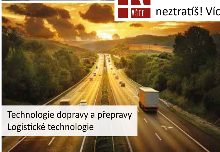
Technologie dopravy a přepravy Logistické technologie

Studuj obory, se kterými se v praxi neztratíš! Více na www.VSTECB.cz