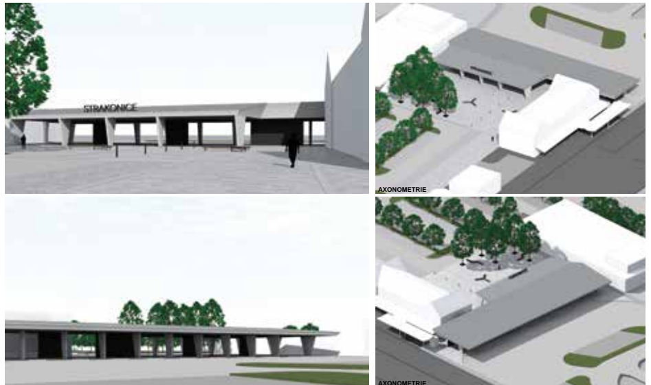
Vizualizace nového terminálu