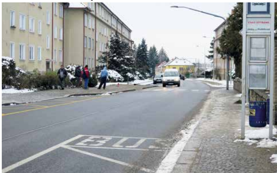
Slavnostní zprovoznění ulice Krále Jiřího z Poděbrad