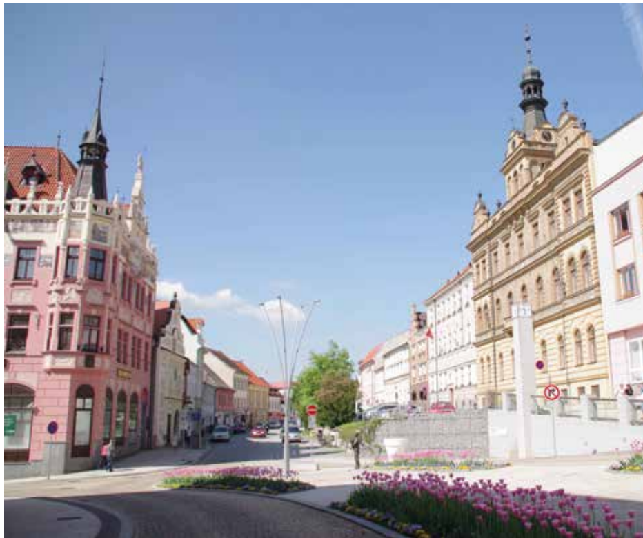
Pohled na západní část Velkého náměstí, která je předmětem architektonické soutěže