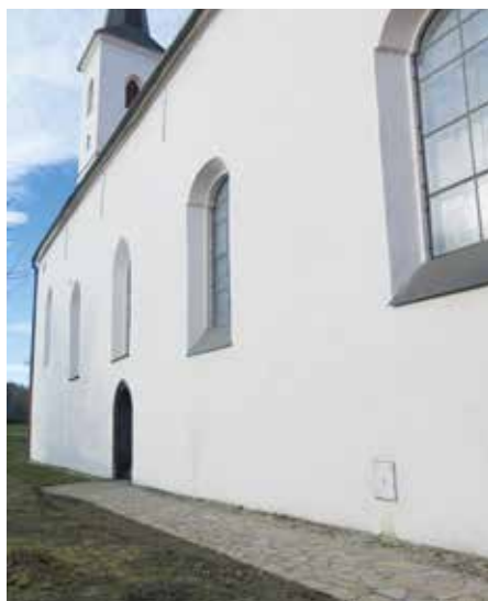
Nový chodník u kostela sv. Markéty

Také přístup do kostela sv. Markéty je nyní bez větších obtíží a bariér. Právě sem zavítají pro posilu, ale třeba i pro chvíli zklidnění a nabrání nových sil nejen vozíčkáři, ale i starší občané, je-