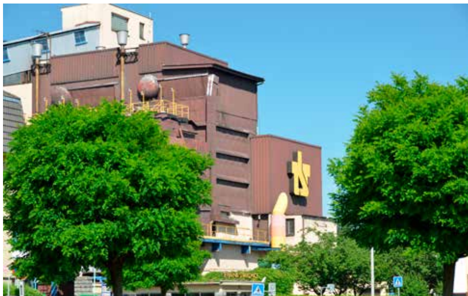
Jeden z objektů strakonické teplárny