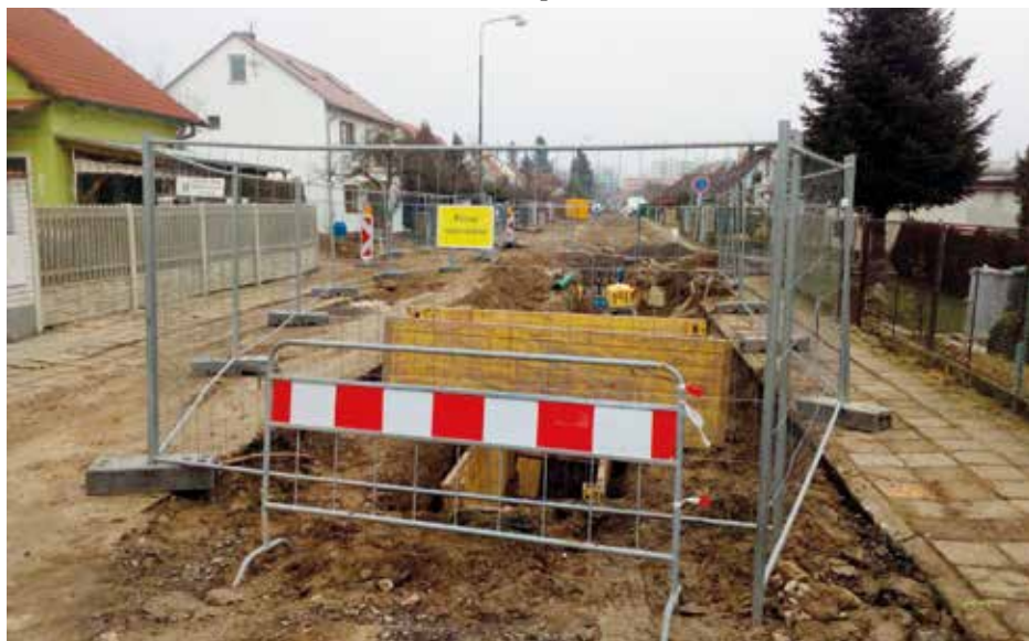
Rekonstrukce ulice Švandy dudáka