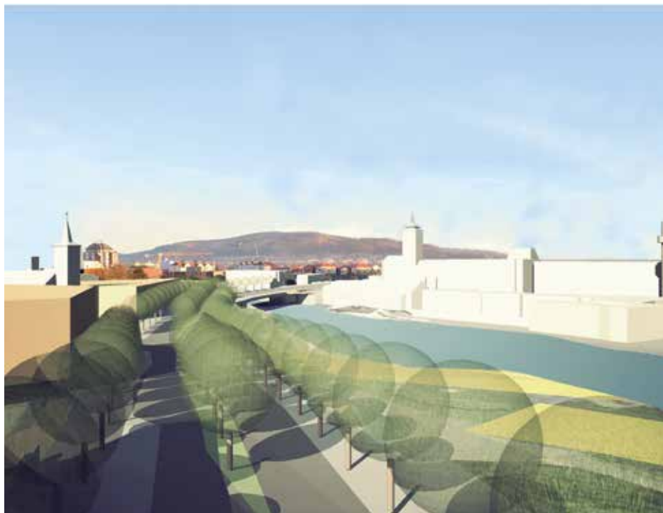
Vizualizace podoby Katovické ulice