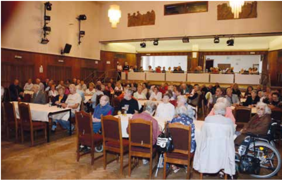
Seniory zaujal pestrý program