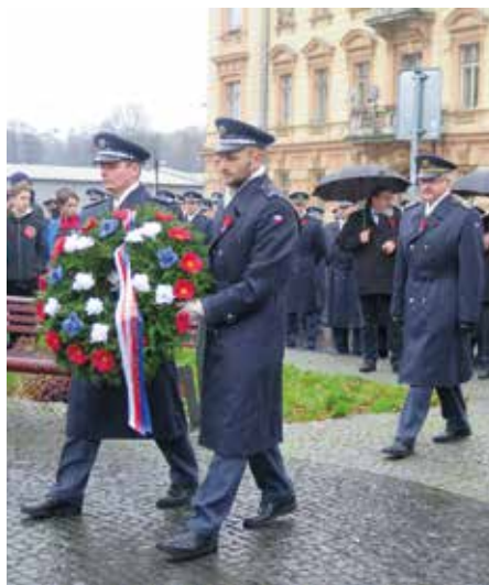
Pietní akt Na Dubovci

Od roku 2001 je v České republice Den veteránů zařazen mezi významné dny. Jeho symbolem je už od konce první světové války květ vlčího máku. První světová válka byla ukončena podepsáním příměří mezi spojenci a Německem ve vlakovém voze v Le Francport u severofrancouzského města Compiègne, díky dokumentu skončily boje na západní frontě.