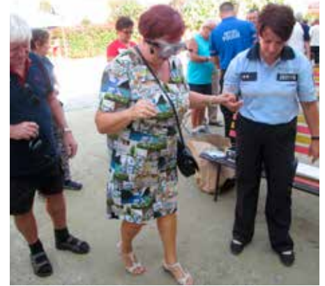
Zájemci si mohli vyzkoušet speciální brýle