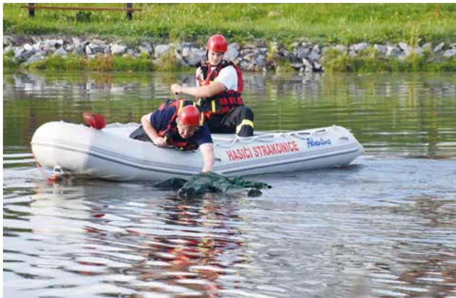
Ukázka záchrany tonoucího

Během cvičení byly z operačního střediska Hasičského záchranného sboru