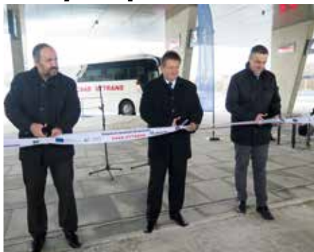
Slavnostní otevření terminálu