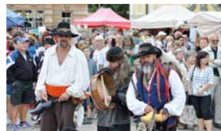
Jednou z akcí podpořených Jihočeským krajem byl i mezinárodní dudácký festival.

RVK, Opatření 5 Ekologická výchova, vzdělávání a osvěta