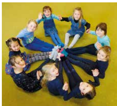
Děti si barevné dny užívají

Dlouhé přípravy masek a kostýmů se vyplátily. Taneční rej s DJ i interaktivní