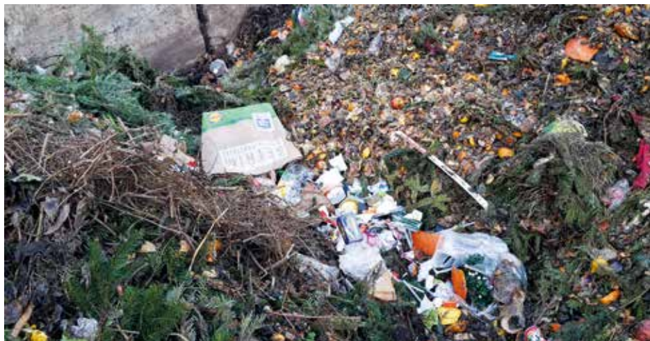
Takto to nechceme