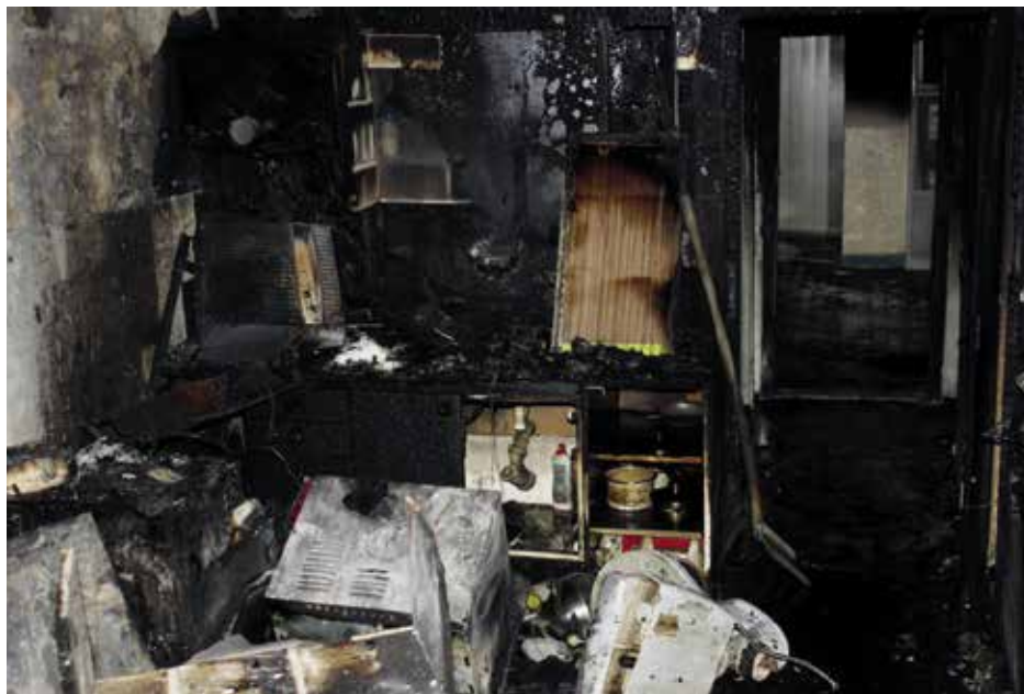
Byt po prosincovém požáru v Povážské ulici