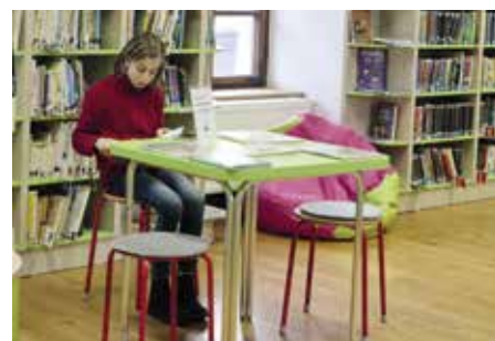
Projekt Společně v knihovně dobrovolníci v knihovně přítomni.

Pomoc mohou využít i bez předchozí domluvy každou středu od 16 do 18 hodin, kdy jsou