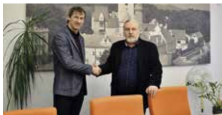
Spolupráce dvou významných institucí

Po první schůzce je jasné, že bude na co se těšit. Z detailního programu můžeme prozradit, že zahajovací společenskou akci spojenou