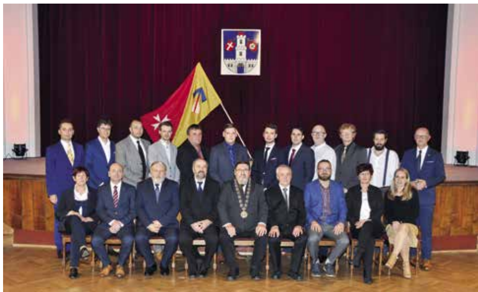
Členové Zastupitelstva města Strakonice