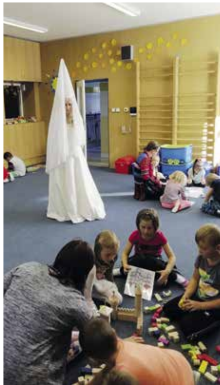
Při hře děti ani nepostřehly, kolik se toho o Strakonících dověděly.

Předškoláci MŠ Šumavská se zúčastnili předškolní akademie – Dobrodružné výpravy do hlubin strakonického hradu, kterou pro mateřské školy připravilo