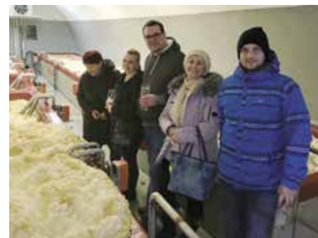
Únorové setkání v pivovare