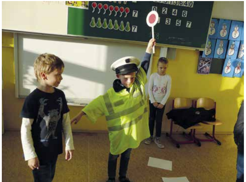
Žáci základní školy Krále Jiřího z Poděbrad

Mnozí si možná myslí, že prevence je zbytečná. Ale kdyby měla pomoci v inkriminovanou chvíli dvěma dětem z dvaceti, je to pro preventistky městské i státní policie satisfakce.