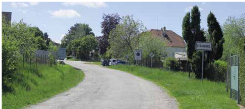
Napojení ulice K Hajské na ulici Podsrpenskou