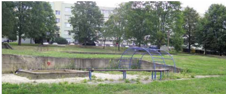
Nevyhovující a zastaralé dětské hřiště

V listopadu roku 2017 se poprvé veřejně projednával ve školní jídelně Základní školy Povážská záměr revitalizace sídliště Šumavská. Tehdy byli osloveni ti, kterých se stav jmenovaného sídliště bytostně dotýká, tedy obyvatelé předmětné lokality. V hojném počtu se dostavili zástupci širokého věkového spektra, aby vyjádřili své potřeby a přání, jaký by mělo sídliště nového tisíciletí mít vzhled a jaké požadavky by mělo splňovat.