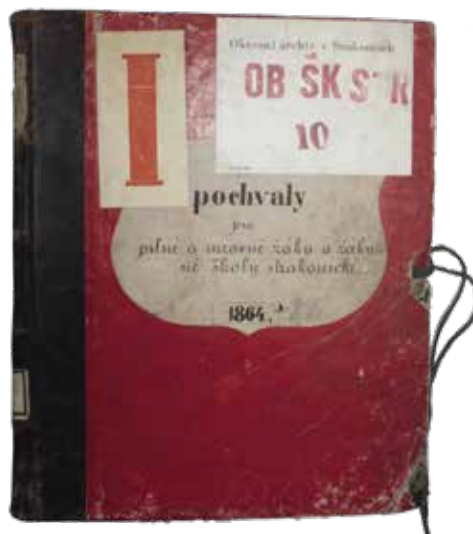
Národní škola Strakonice, 1864-1889

Zápisy v knihách cti byly vedeny chronologicky a po jednotlivých třídách. Z prozkoumaného materiálu vidíme, že na počátku devatenáctého století bylo se zápisy více šetřeno. Za každou věc, jako bylo chování, pilnost nebo dobré studijní výkony, byly vyznamenání dva tři studenti. V pozdějších letech se ustálil zvyk chválit především za prospěch a docházku, tedy už nerozlišovat pochvaly za konkrétní předměty. Počet zapisovaných studentů stoupal. Navíc se zavedlo i stupňovité hodnocení, kdy na prvních místech se psali ti nejlepší, následně se poznamenalo: „a k nim se přibližují,“ a vypsal se další žáci. Zápisy tak částečně ztratily pro žáky na své výjimečnosti.