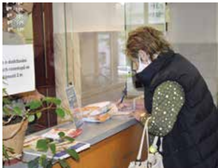
Přebírání roušek na podatelně MěÚ

KPZ – krajská pomoc zranitelným, tak se nazýval projekt Jihočeského kraje, který odstartoval ke konci dubna. Jihočeský kraj distribuoval na jednotlivé správní obvody pověřených městských úřadů hmotnou pomoc pro jednu z nejohroženějších skupin obyvatel. Šlo převážně o lidi s vážnými zdravotními problémy, chronicky či onkologicky nemocné, pacienty s oslabenou imunitou a osoby o ně pečující. Tito lidé se mnohdy v obavě o své zdraví raději ani nesnažili vycházet ze svých domovů