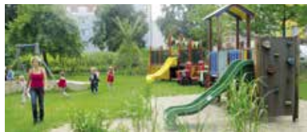
Děti i rodiče uvítali obnovený provoz

Vládní opatření přiměla zřizovatele, v tomto případě město Strakonice, ke zcela nepopulárnímu opatření, jakým bylo 16. března uzavření mateřských škol. Rodiče „školčáků“ byli postaveni před nelehkou situací, která ale v daný okamžik měla své opodstatnění. Dnes vychází celkově Česká republika jako země s nejméně nakaženými nemocí covid-19, za čímž stojí právě ona striktní opatření.