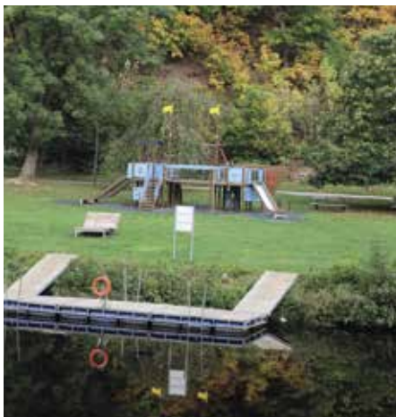
Molo příjemný pobyt u vody

„Vzpomínám si, že tehdy existovala myšlenka, která mě obrovsky nadchla. Bylo to něco nového, co mě vždy baví. Jeli jsme se s manželkou inspirovat na Slapy, kde něco podobného bylo.“