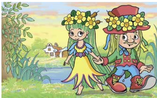
Rusalka Blanička a vodník Otík

V řekách Blanici a Otavě, a také v mnoha rybnících na území Prácheňska pobývají pohádkové perlorodky. Tajemné vodní