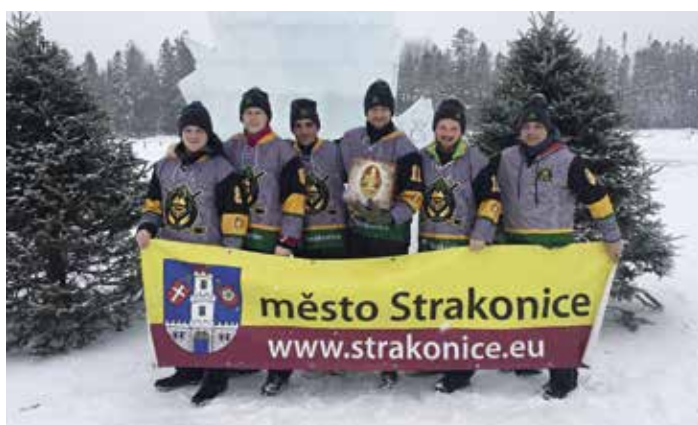
Rybníkový turnaj v Kanadě podpořilo město v roce 2020