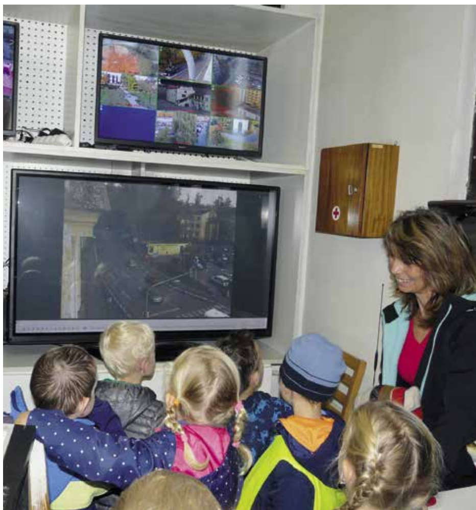
MŠ Stavbařů v místnosti stálé služby, kde se mimo jiné obsluhují kamery

V roce 2019 zaznamenal městský kamerový systém celkem 51 událostí, z toho dva trestné činy a jednou záchranu života. Bohužel se stává, jako u každé techniky, že zaznamenáme během roku poruchu na jednotlivých kamerách či systému. I to byl důvod, proč jsme se rozhodli jít cestou zkvalitňování, nikoli kvantity.