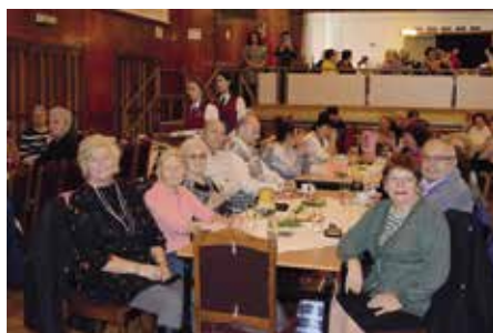
Setkání seniorů v roce 2019

Dovolujeme si oznámit, že po dvouměsíční odmlce (v listopadu a v prosinci 2020), při které byly jubilantům města Strakonice dárkové poukazy rozesílány poštou, budou od ledna 2021 pracovnice infocentra pro