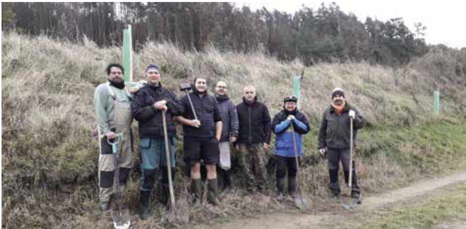
Úředníci vysazovali stromky