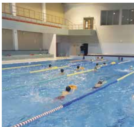
Výuka v plavecké škole

Aby byla plavecká výuka efektivní, je nutné začít nejdříve v první třídě základní školy. V tomto věku většinou umí plavat necelá třetina dětí. Dvě třetiny z nich se s vodou sice setkaly, ale neumí vůbec plavat v hloubce. Některé mají dokonce fobii z vody, pramenící z neznámého prostředí. Vhodně zvolená metodika plavání pro takto malé děti dokáže mnohé z nich posunout z úplných neplavců na úroveň bezpečného plavání bez pomůček s instruktorským dozorem. Především ale získají vztah k vodě a tím i bezpečnost pro sebe sama při hrátkách v letních měsících u vody.