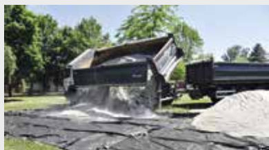
Budoucí písečná pláž, Markéta Bučoková

Prvního června byly otevřeny brány letního plaveckého areálu ve Strakonících. Co nového na návštěvníky během prázdninových dnů čeká? Především to bude písečná pláž plná slunečníků a lehátek od pivovaru Dudák a hned vedle golfového hřiště vyrostle vzduchová trampolína o rozměru téměř 80 m 2 .