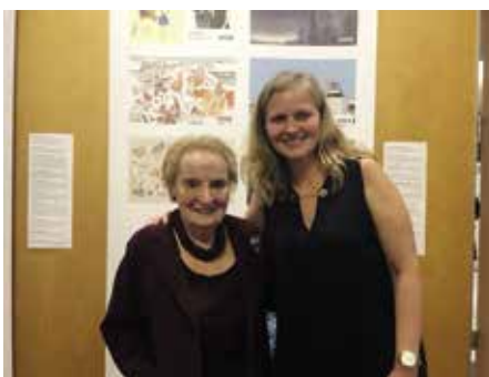
Setkání s Madeleine Albrightovou

Pracovala jste jako vedoucí obchodně ekonomického úseku konzulátu ČR v Austrálii, co vaše práce obnášela?