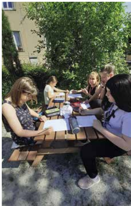
Návrat dětí do školních lavic

Milí žáci, plně si uvědomuji, že učení prostřednictvím počítačů, tabletů a chytrých telefonů nebylo to pravé ořechové. Že jste nemohli navštěvovat své oblíbené kroužky, společně se setkávat či cestovat. Za všechny pedagogy naší školy vám proto přeji, abyste si toto léto obzvláště užili. Abyste v jeho průběhu zažili mnoho krásných „neonline“ zážitků se svými rodiči a kamarády někde u vody, na táboře,