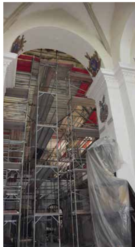
Interiér kostela sv. Prokopa

Mezi žádostmi a realizací vystoupaly ceny, a tak musely být z projektu vyškrtnuty dva boční oltáře, které ale našťástí nejsou v kritickém stavu, a doufáme, že na ně v budoucnu dojde. Opravou procházejí, depozitáře, které se nalzájí podél celé