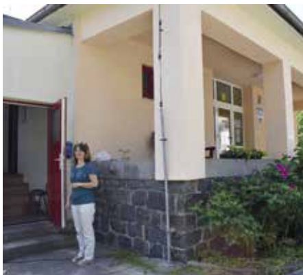
V těchto místech vznikne nový ateliér

Komu bude určen výtvarný ateliér, jsme se zeptali zástupkyně ředitelky Jany