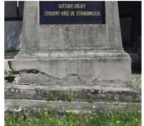
Pomník u kostela sv. Václava

Rádi bychom využili vaši pomoc při doplnění seznamu. Podklady můžete zaslat na adresu: peter.kurek@mu-st.cz .